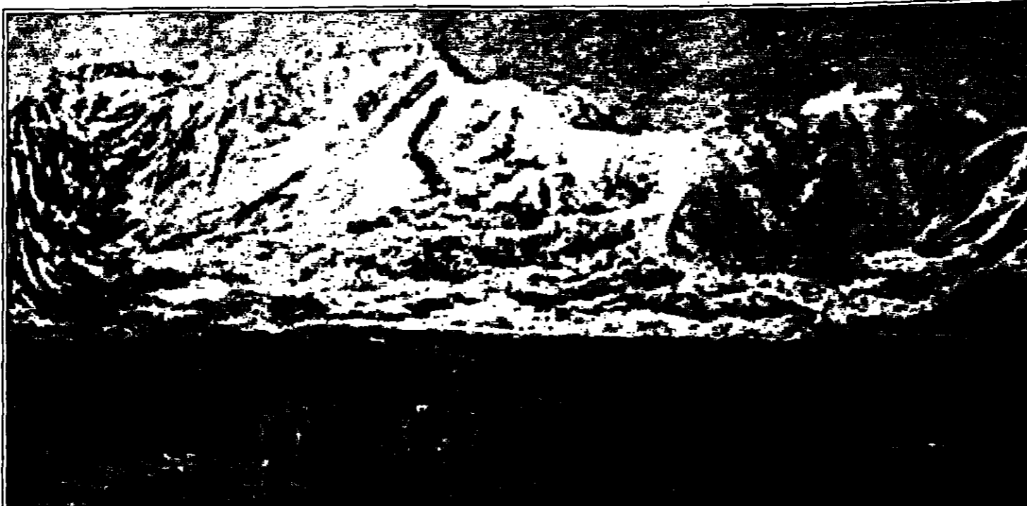
اللوحة من اعمال محمد دسوقي (القدس العربي)

وقد التفت الفنان التشكيلي هذا للتطور وابع فيه، ومل ان هذا التناغم والحوار بين المساحات للتعبية منح العمل